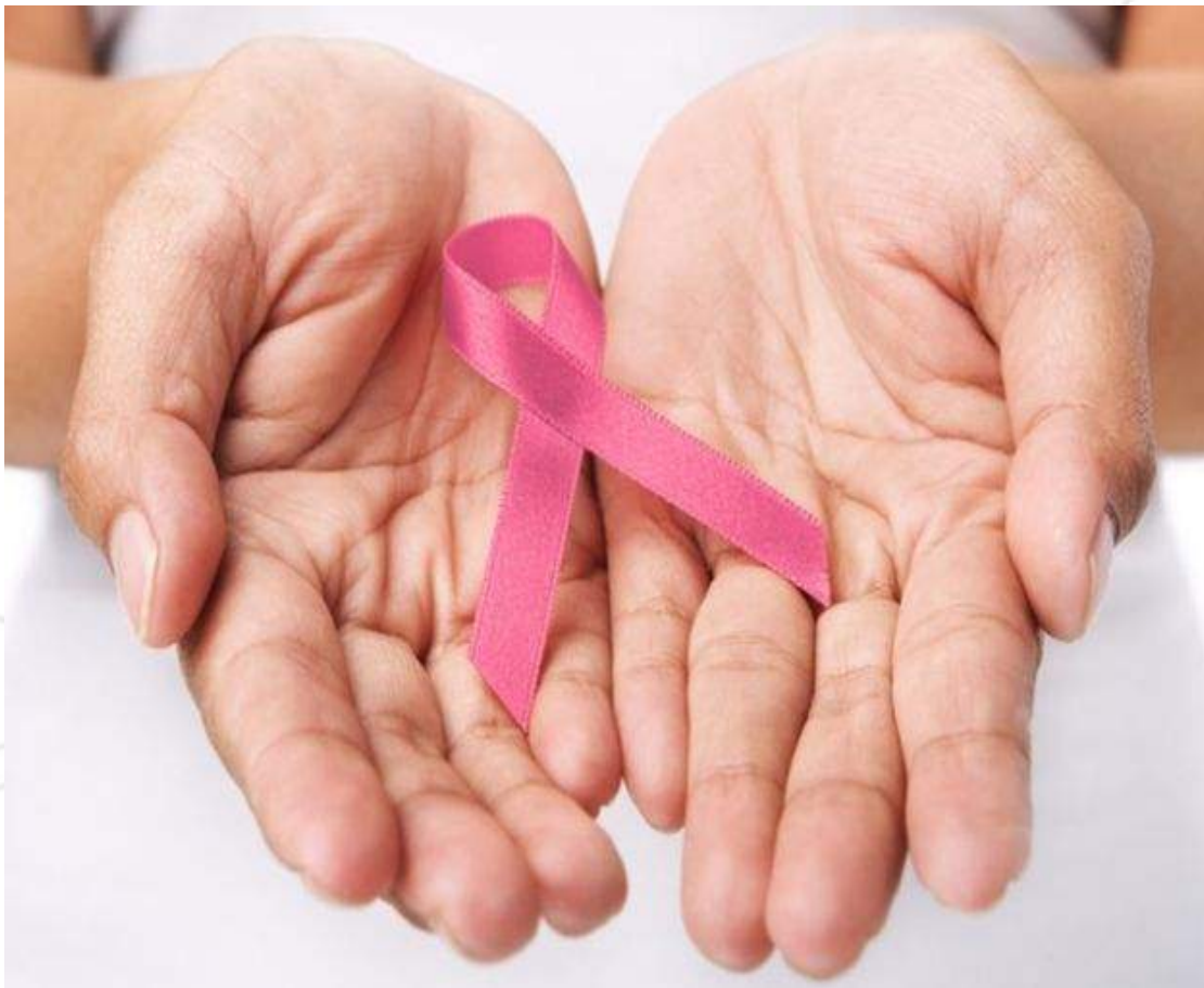
Fotografía de Ilustración.