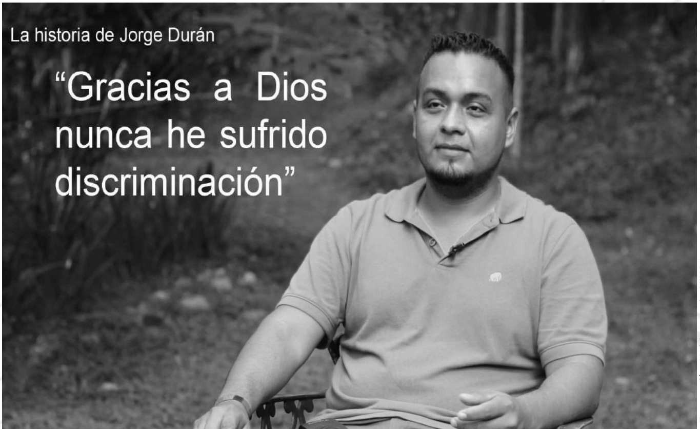
Fotografía Hablemos de VIHDA.

“Gracias a Dios nunca he sufrido discriminación”